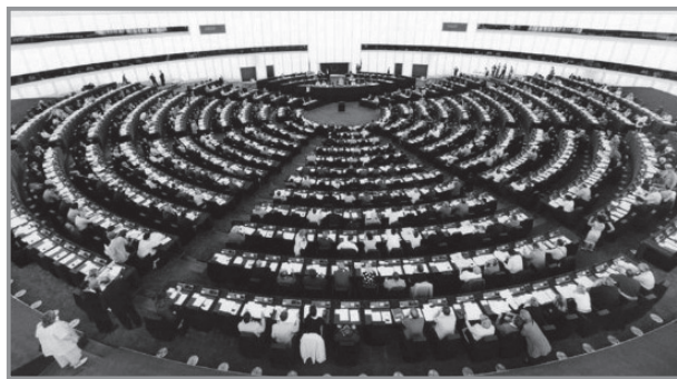
Het Europees Parlement lijkt wel op het éénpartijstelsel van de Sovjetunie.

In de EU kan men niet spreken van datzelfde spel tussen wetgevende en uitvoerende macht en tussen oppositie en meerderheid. De Europese Commissie is een instelling van niet-verkozen hoge ambte-