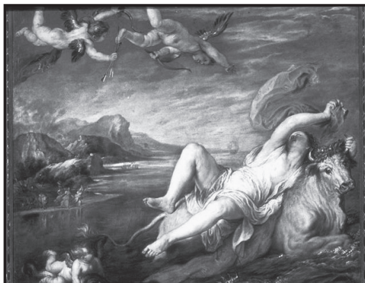
De verkrachting van Europa - P. P. Rubens

De huidige politiek-correcte machthebbers verkrachten Europa. De Tsjechische president Vaclav Klaus had het in zijn toespraak bij het rechte eind. Het is meer dan ooit tijd dat er een tegenbeweging komt in Europa, een tegenbeweging die de volkeren en de burgers terug op het voorplan brengt. Het Vlaams Belang zal daar in ieder geval ten volle aan meewerken.